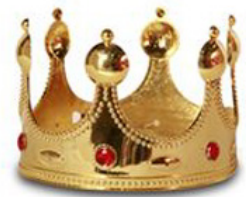
korona (festményen, szobron)