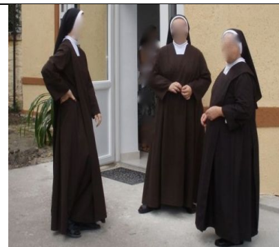
szereztesnővér / apáca