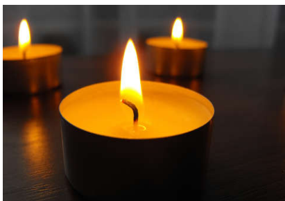
égő gyertya vagy mécses