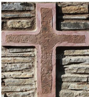
kereszt (falon vagy képen)

- HÚZD ÁT A KÉPET, AMIT LÁTTÁL AZ ÚT SORÁN -