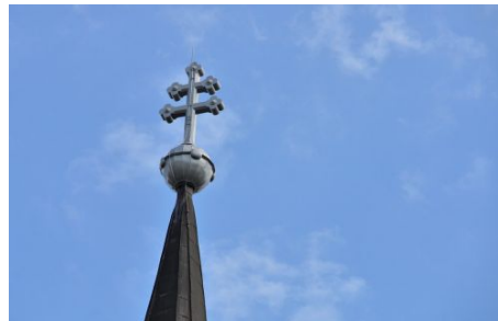
kettős kereszt a templom tetején