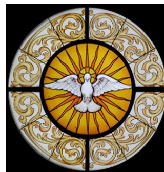
szentlélek galamb (festmény vagy szobor)